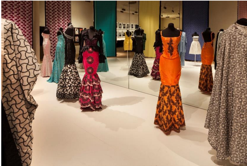
„African Lace“ im Vorarlberg Museum in Bregenz

Im westafrikanischen Mali konnte man eine 900-jährige Sticktradition nachweisen. Die früheren Reiche hier kontrollierten den Handel durch die Sahara. Im späten 19. Jahrhundert wurde Mali Teil der französischen Kolonie Französisch-Sudan. Es leben hier Menschen verschiedener Sprachen und Kulturen – Zuordnung und Grenzen sind zum Teil Konstrukte aus der Kolonialzeit. Auch im heutigen Nigeria gab es alte Handelszentren mit Verbindungen zwischen dem Süden, Nordafrika und dem Mittleren Osten. Die Islamisierung beeinflusste die Stickerei, als dann die herrschende Oberschicht nach entsprechender Kleidung verlangte.