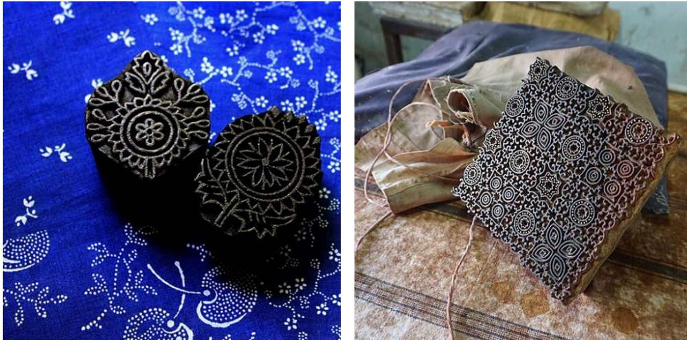
Blaudruck mit Modeln