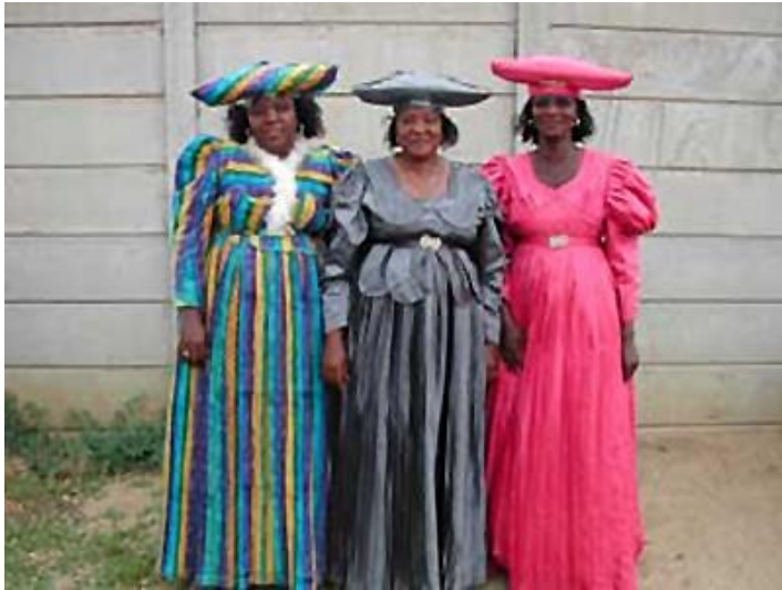
Herero-Frauen in Windhoek