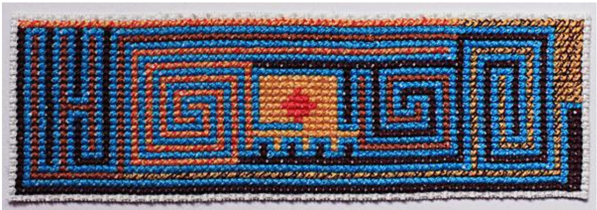
GALERIE – KULTUR: Wege (Labyrinth) Design und Produktion von Christine Ober