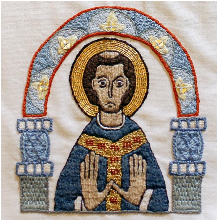
Heiliger im Mittelalter – inspiriert von „Benedictiones pontificales“ (Lorsch, 11. Jahrhundert - Paris, Bibliothèque Sainte-Geneviève)