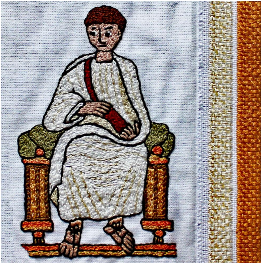
Römer mit Tunika und Toga – inspiriert von „Vergilius romanus“ (5. Jahrhundert - Vatikan, Bibliotheca Apostolica Vaticana)