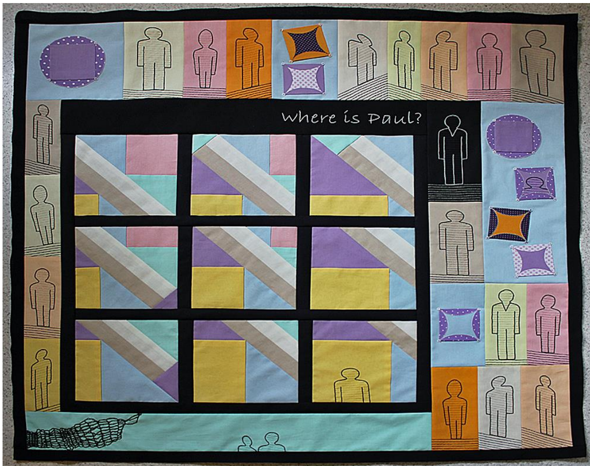
Suchbild „Wo ist Paul?“